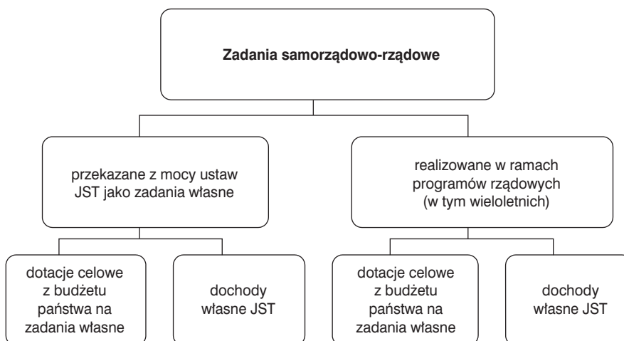
Rysunek 2. Zadania samorządowo-rządowe i źródła ich finansowania

rialnego – gminie, powiatowi, województwu – w drodze ustawy, charakteryzujące się zabezpieczeniem finansowym w wysokości koniecznej do ich realizacji w postaci zwiększenia dochodów własnych, subwencji oraz dotacji celowej z budżetu państwa na finansowanie lub dofinansowanie zadań własnych. Kategoria ta obejmuje również zadania realizowane w ramach programów